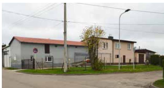
Koszt całej inwestycji szacowany jest na ok. 4,7 mln. Połowę środków stanowi dofinansowanie z Funduszu Dróg Samorządowych

Według przyjętego harmonogramu realizacja inwestycji powinna zakończyć się w czerwcu 2022 roku. Decydujące znaczenie będzie miało rozstrzygnięcie postępowania przetargowego.