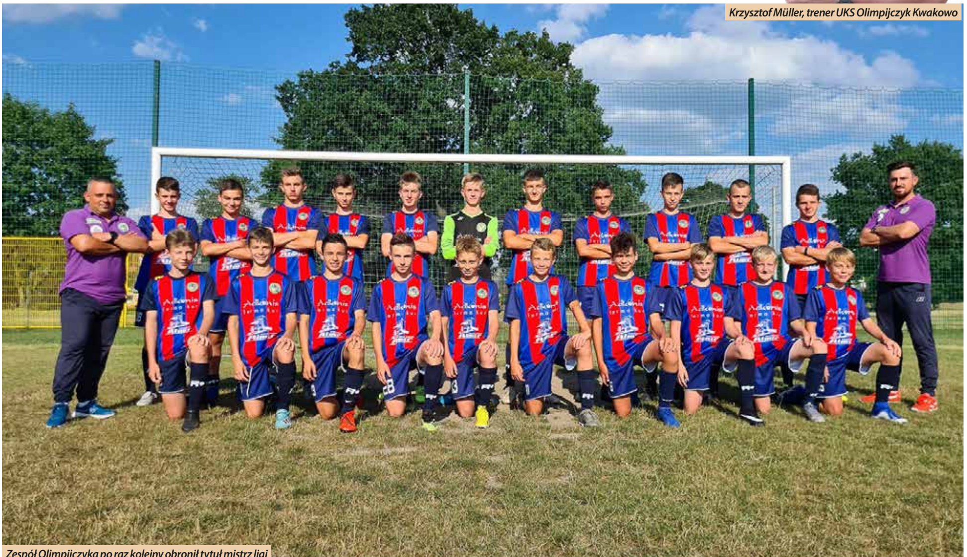
Zespół Olimpijczyka po raz kolejny obronił tytuł mistrz ligi