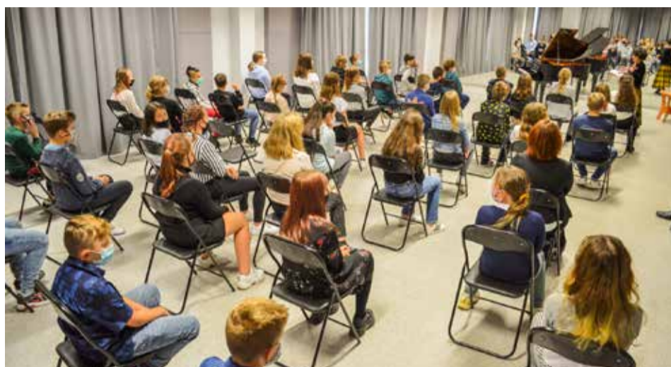
Dla wielu młodych ludzi koncert w GCKiP był pierwszą okazją do zetknięcia się z takim formatem muzycznym