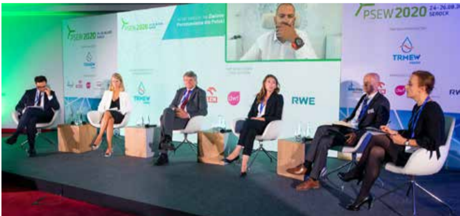
W Serocku zebrali się przedstawiciele rządu i samorządu, firm z całej Europy, developerów, inwestorów, producentów podzespołów, przedstawicieli sektora dystrybucji energii a także stowarzyszeń branżowych, by wspólnie debatować nad stanem polskiej energetyki wiatrowej

Rozwój polskiego sektora lądowej i morskiej energetyki wiatrowej może stać się z kolei paliwem do budowania innowacyjnej, niskoemisyjnej energetyki i nowoczesnego przemysłu w kraju, a także dać istotny wkład w dążeniach Unii Europejskiej do neutralności klimatycznej w perspektywie 2050 r. Podejmowane dzisiaj decyzje będą zaś silnie rzutować na przyszłość - ekonomiczną, gospodarczą i ekologiczną.