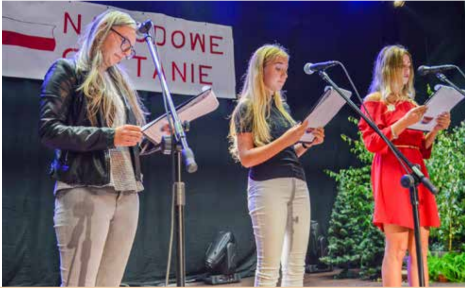
Poszczególne fragmenty dzieła Juliusza Słowackiego odczytywali radni, urzędnicy, mieszkańcy i uczniowie

intensywniej przeżywać emocje towarzyszące prezentacji jednego z najwybitniejszych dzieł polskiej literatury.