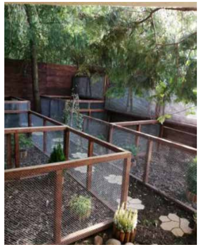
Między innymi takie obiekty powstają obecnie w ośrodku rehabilitacji dzikich zwierząt w Kobylnicy

Od wczesnej jesieni przyjmujemy bardzo dużą liczbę jeży, młode zające, wiewiórki oraz piskląta grzywaczy. Jest to