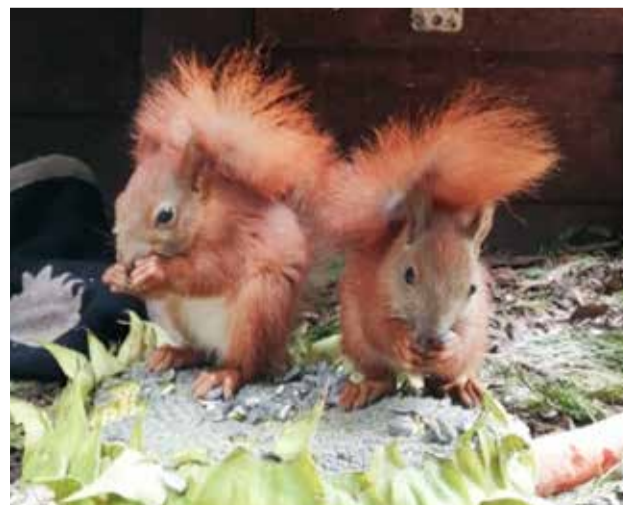
Wśród pacjentów, którzy trafiają pod opiekę Fundacji Dzikie Azyl pojawiają się wiewiórki

Ogólnie tak, mimo to, że wiele z naszych planów nie zostało zrealizowanych przez pandemię. Rozwijamy się i zmieniamy, z roku na rok przyjmujemy coraz to większą