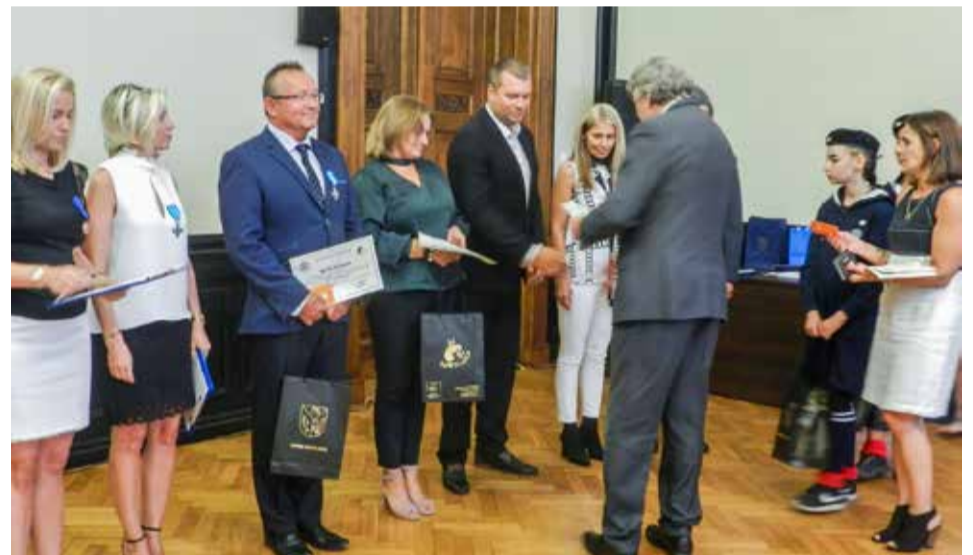
VI Słupska Konferencja Marynistyczna była okazją do podsumowania dotychczasowych działań i wytyczenia nowych kierunków na przyszłość