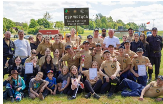
OSP Wrząca Mistrz Gminy Kobylnica w Gminnych Zawodach Sportowo-Pożarniczych drużyn OSP

Najlepsze drużyny OSP reprezentowały Gminę Kobylnica podczas Powiatowych Zawodów Sportowo-Pożarniczych drużyn OSP w Potęgowie 21 czerwca 2026 roku.