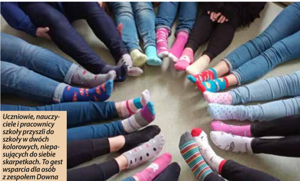
Uczniowie, nauczyciele i pracownicy szkoły przyszli do szkoły w dwóch kolorowych, niepasujących do siebie skarpetkach. To gest wsparcia dla osób z zespołem Downa

Data obchodów tego święta jest symboliczna, ponieważ ludzie z zespołem Downa mają dodatkowy chromosom numer 21. Mają ich trzy zamiast dwóch. Dlatego ta choroba genetyczna bywa też nazywana trisomią 21.