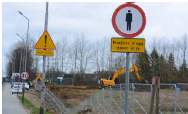
Salon Agata Meble powstaje przy ulicy Szczecińskiej. Kierowcy mogą obserwować prace przy budowie dużego obiektu

Kolejna inwestycja to także kolejna szansa na rozwój gospodarczy. Już dziś przedstawiciele sieci salonów me-