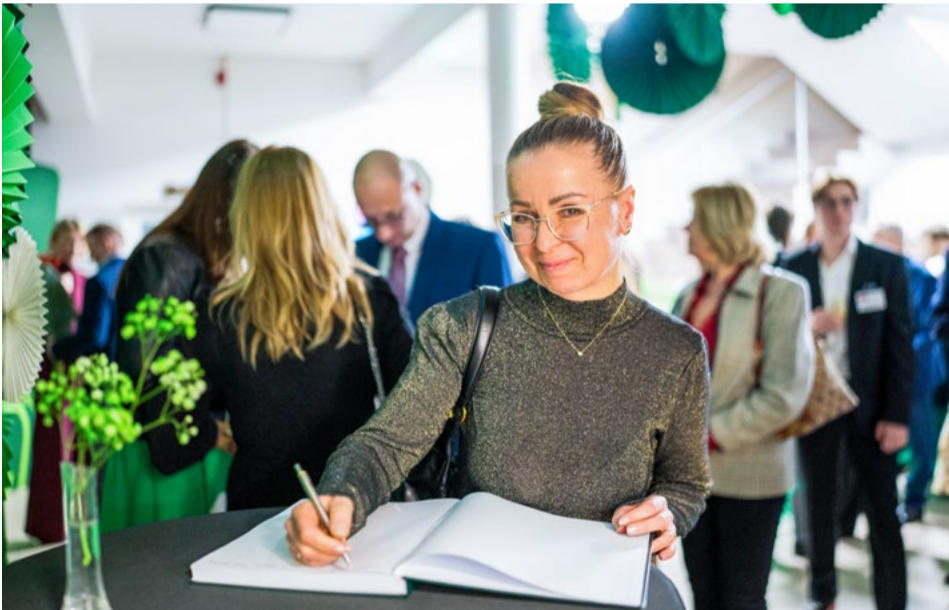
Przybyli goście wpisywali się do pamiątkowej księgi.