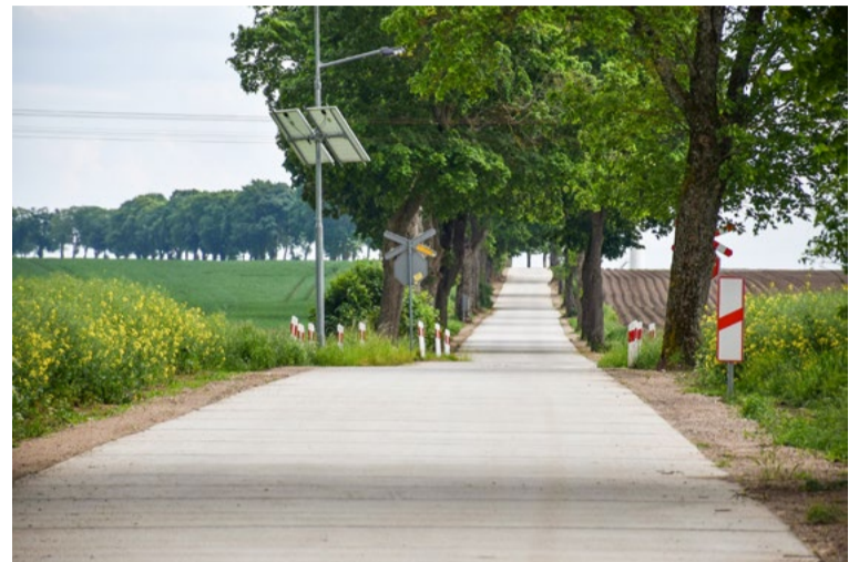
W 2024 roku Gmina Kobylnica zakończyła m.in. IV etap budowy drogi pomiędzy miejscowościami Słonowice i Kończewo.

W ramach dofinansowania z Rządowego Funduszu Polski Ład: Program Inwestycji Strategicznych zmodernizowano kilka odcinków dróg na terenie gminy. W Sierakowie przebudowana została ulica Dębowa. W Kuleszewie nową nawierzchnię zyskały dwie drogi wewnętrzne. W Komorzynie wybudowano chodnik, a droga betonowa o szerokości 3,5 metra i szerokimi poboczami łączyła miejscowości Zbyszewo