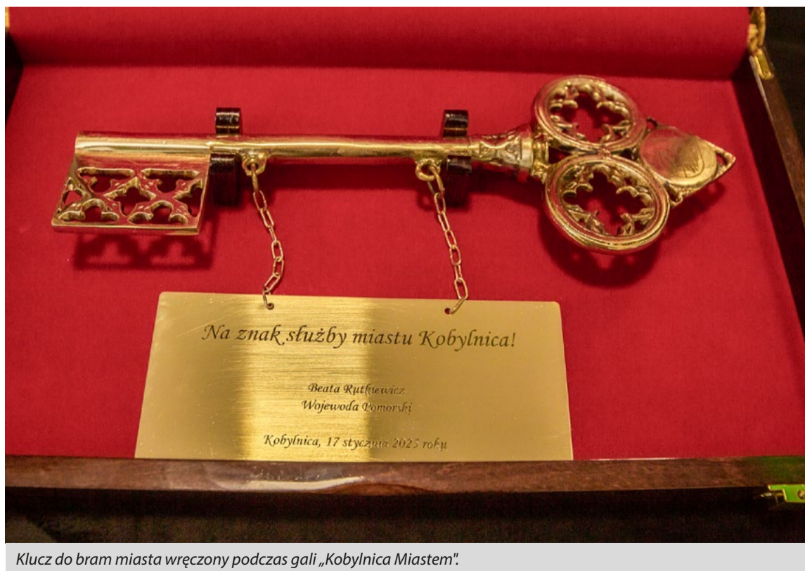
Klucz do bram miasta wręczony podczas gali „Kobylnica Miastem”.

Te kilkuminutowe wideo nie miało podkreślić raz jeszcze, jak ogromną