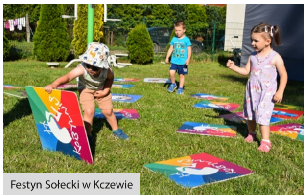
Festyn Sołecki w Kczewie