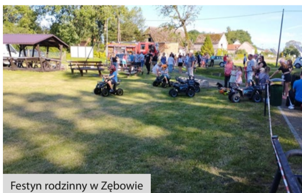
Festyn rodzinny w Zębowie