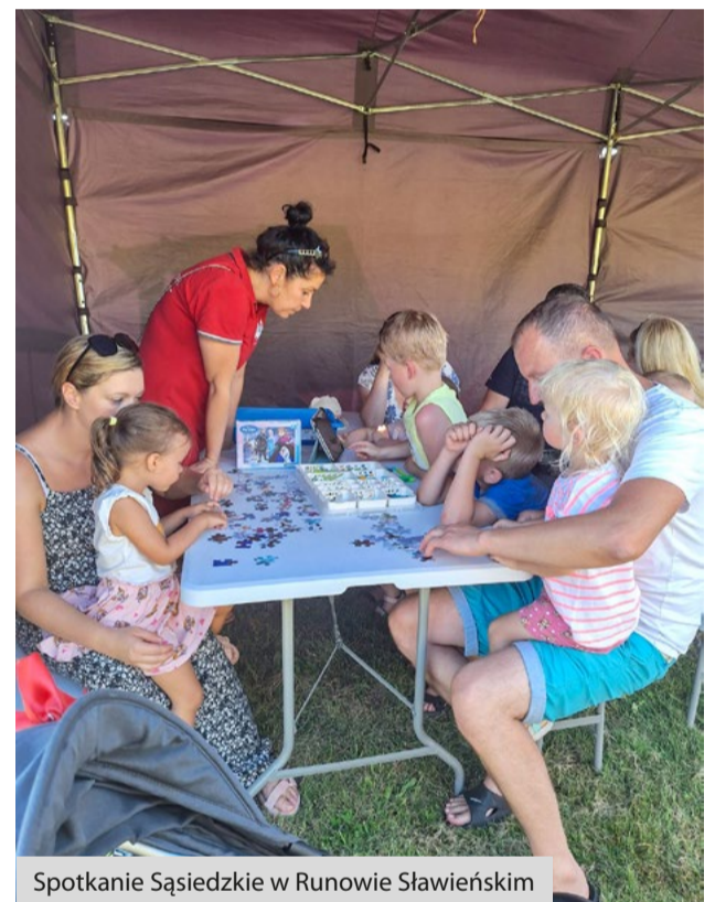
Spotkanie Sąsiedzkie w Runowie Sławieńskim