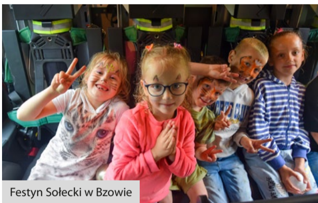
Festyn Sołecki w Bzowie