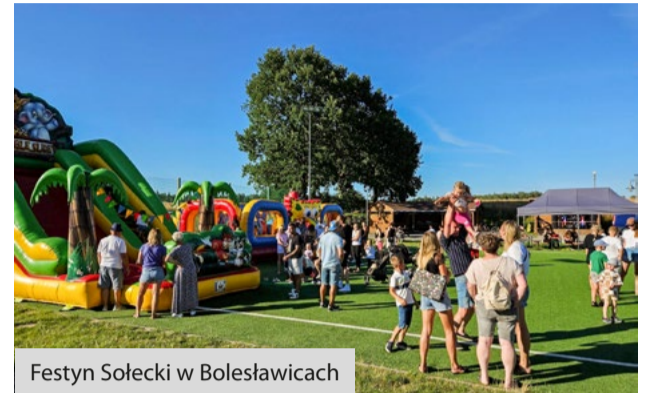
Festyn Sołecki w Bolesławicach