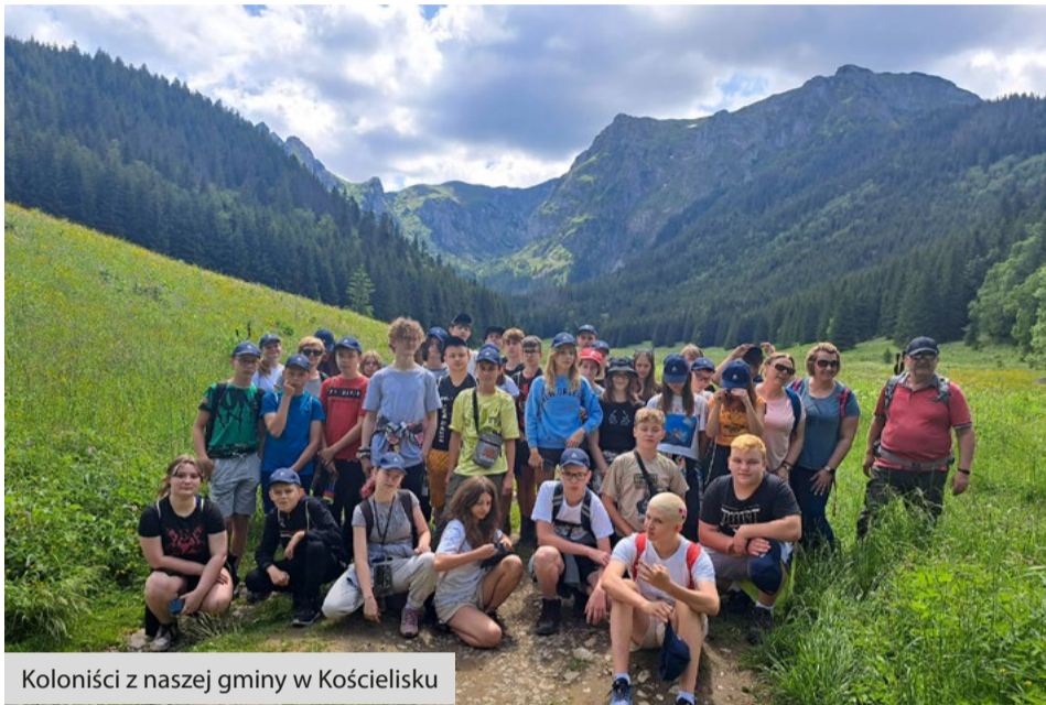
Koloniści z naszej gminy w Kościelisku