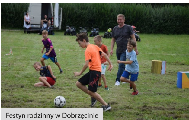
Festyn rodzinny w Dobrzęcinie