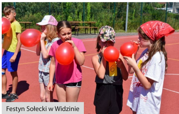
Festyn Sołecki w Widzinie