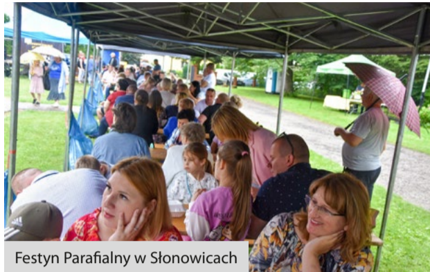
Festyn Parafialny w Słonowicach

nicy m.in. spróbowali swoich sił w zdrowej rywalizacji, skorzystali z animacji i przejazdów quadami i oraz zobaczyli z bliska wóz strażacki. Dorośli dodatkowo mogli wziąć udział w zabawach tanecznych, loteriach fantowych czy spróbować specjałów ze stref gastronomicznych. Każdy mógł znaleźć coś dla siebie i miło spędzić popołudnie w towarzystwie rodziny i przyjaciół.