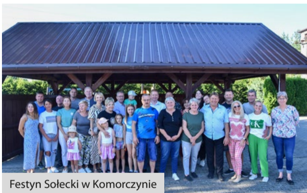
Festyn Sołecki w Komorczynie