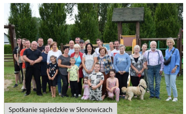
Spotkanie sąsiedzkie w Słonowicach