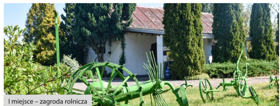
I miejsce – zagroda rolnicza

Punkt konsultacyjny Programu „Czyste Powietrze” znajduje się w Urzędzie Gminy, ul. Główna 20, budynek A, pok. 3, tel. 59 858 62 58.