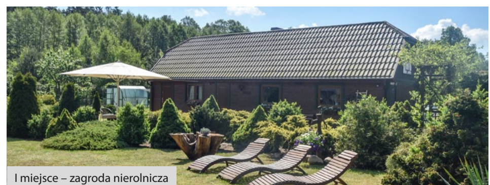
I miejsce – zagroda nierolnicza