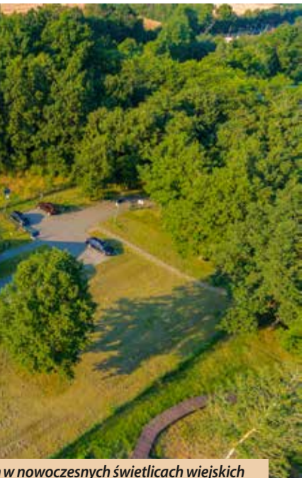
w nowoczesnych świetlicach wiejskich

nej mapie Polski. To wydarzenie, które niewątpliwie pokazało jak fantastycznie potrafią się bawić nasi mieszkańcy i przyjezdni fani muzyki disco polo. Dzięki wielomiesięcznej pracy