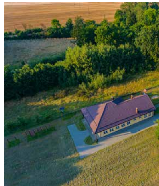
Siłą Centrum jest też różnorodność działań organizowanych

Dziesięć lat pracy to okres niezwykłych wspomnień, które zrodziły się w czasie licznych przedsięwzięć, realizacji śmiałych działań i projektów. Przed pracownikami Gminnego Centrum Promocji wciąż jednak sporo wyzwań i planów, których efekty mają cieszyć mieszkańców Gminy Kobylnica.