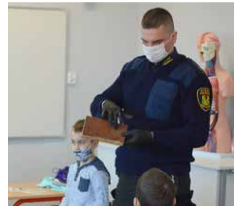
Strażnicy rozmawiają z dziećmi między innymi o tym, jakie produkty trafiają do naszych pieców

Jest to kolejna akcja edukacyjna realizowana przez Straż Gminną w Kobylnicy. Wcześniej funkcjonariusze spotykali się z uczniami, by rozmawiać między innymi o gospodarce odpadowej i właściwej segregacji odpadów.