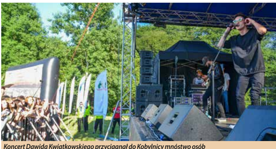
Koncert Dawida Kwiatkowskiego przyciągnął do Kobylnicy mnóstwo osób