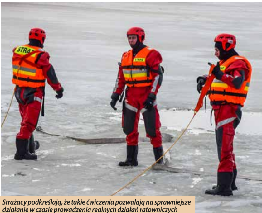
Strażacy podkreślają, że takie ćwiczenia pozwalają na sprawniejsze działanie w czasie prowadzenia realnych działań ratowniczych