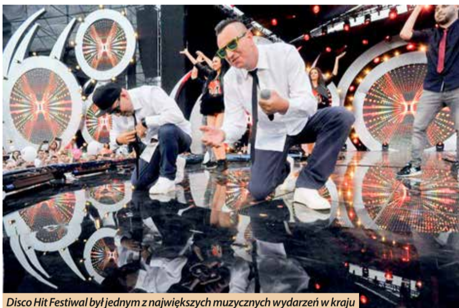
Disco Hit Festiwal był jednym z największych muzycznych wydarzeń w kraju