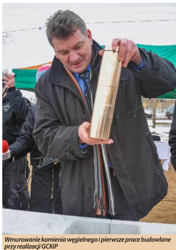
Wmurowanie kamienia węgielnego i pierwsze prace budowlane przy realizacji GCKiP

impresą niezależną od jakiegokolwiek wydarzenia tylko wydarzeniem dającym możliwość zaprezentowania się znanym artystom, ale i także tym którzy dopiero zaczynali swoją przygodę