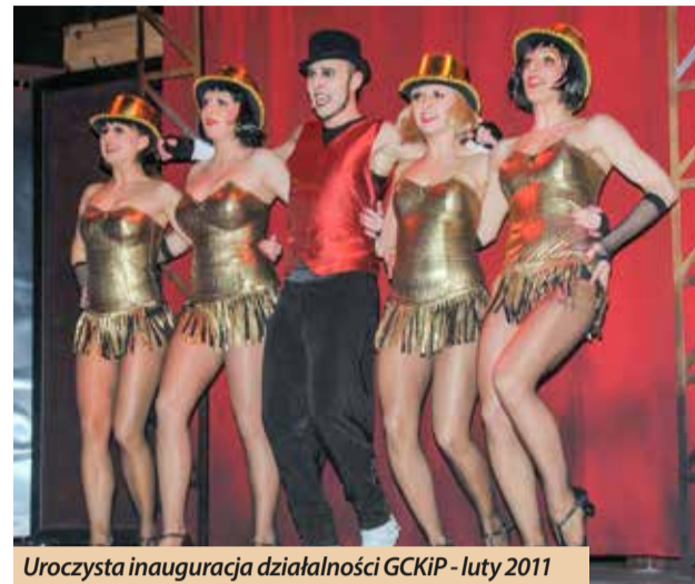
Uroczysta inauguracja działalności GCKiP - luty 2011

Można śmiało powiedzieć, że muzyka łatwa, miła i przyjemna zawsze towarzyszyła mieszkańcom gminy Kobylnica. Zazwyczaj podczas każdej imprezy plenerowej oprócz topowych gwiazd pojawiały się zespoły disco - polo. I tak po rozmowach z panem wójtem i właścicielem jednej z agencji muzycznej maszyna ruszyła. Narodził się pomysł festiwalu, który będzie wielkim świętem muzyki disco polo. Festiwal, który od początku był