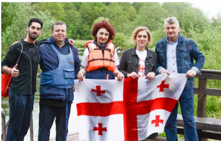
GCKiP odpowiada także za realizację działań w obszarze współpracy z partnerskimi samorządami