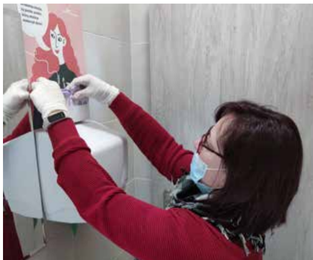
Skrzynki i plakaty z kieszonkami. Kobiety mogą skorzystać ze znajdujących się tam darmowych środków higieny

- Chcemy aby już żadna kobieta nie czuła się skry-