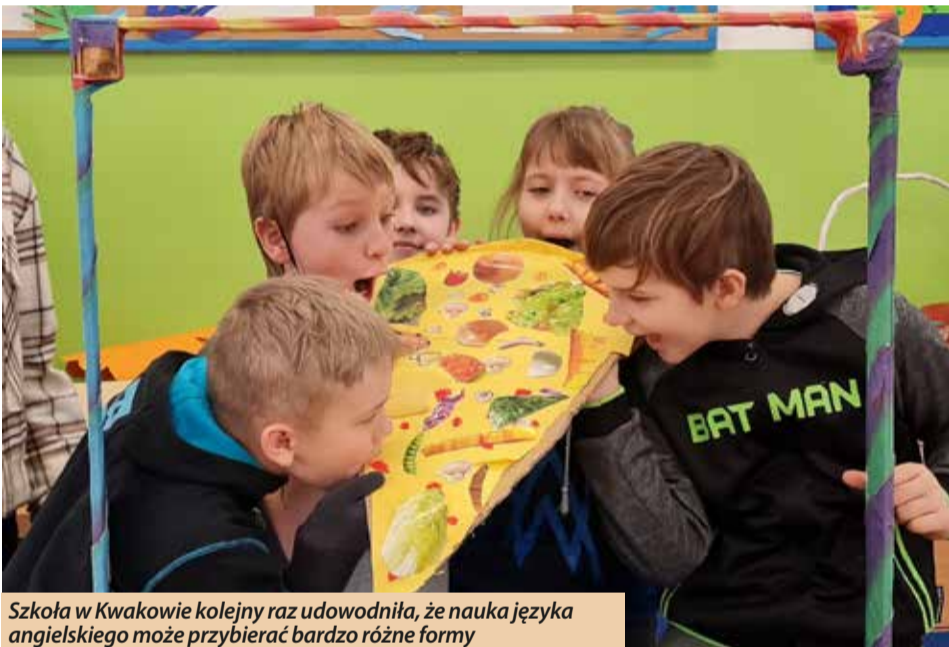
Szkola w Kwakowie kolejny raz udowodniła, że nauka języka angielskiego może przybierać bardzo różne formy

Lekcje prowadzone tego dnia były doskonałą okazją do nauki nowego słownictwa związanego z jedzeniem w języku angielskim, ale również do przypomnienia sobie tłumaczeń części ciała oraz kuchennych akcesoriów.