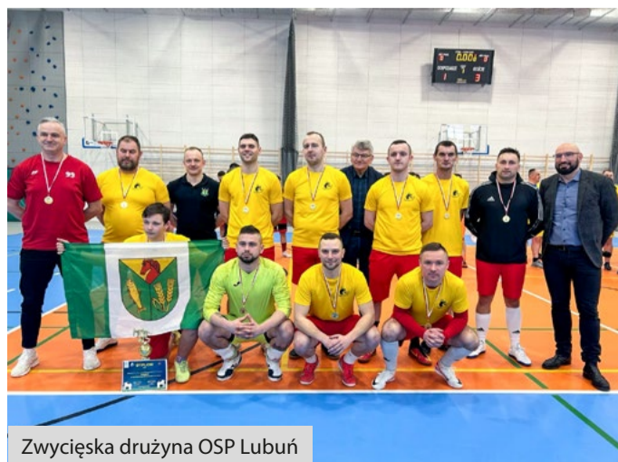
Zwycięska drużyna OSP Lubuń

W emocjonującym Halowym Turnieju Piłki Nożnej Drużyn OSP z Powiatu Słupskiego, który odbył się w Kwakowie, zwycięstwo odnieśli utalentowani reprezentanci Gminy Kobylnica – drużyna OSP Lubuń.