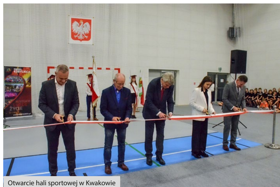
Otwarcie hali sportowej w Kwakowie