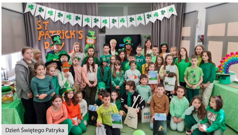
Dzień Świętego Patryka

Miniony rok był pełny zarówno wyzwań, jak i niesamowitych osiągnięć uczniów ze Szkoły Podstawowej im. Polskich Olimpijczyków w Kwakowie. W 2023 roku miały miejsce nie tylko cykliczne uroczystości, ale także nowe, niepowtarzalne i angażujące wydarzenia, których znaczenie wykroczyło daleko poza szkolne mury w Kwakowie. Poza zdolnościami uczniów rozwinął się również budynek samej szkoły, aby jeszcze mocniej wspierać edukację naukową, sportową oraz kulturalną uczniów z Gminy.