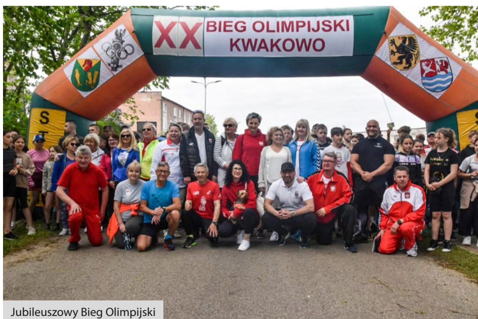
Jubileuszowy Bieg Olimpijski

Oprac. Szkoła Podstawowa im. Polskich Olimpijczyków w Kwakowie