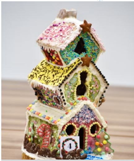
Pierwsze miejsce w konkursie Domek z Piernika

Gminne Centrum Kultury i Promocji w Kobylnicy ogłosiło wyniki IV edycji Rodzinnego Konkursu na „Domek z Piernika”. Zadanie uczestników było niezwykle wymagające – własnoręczne wykonanie domku z piernika.