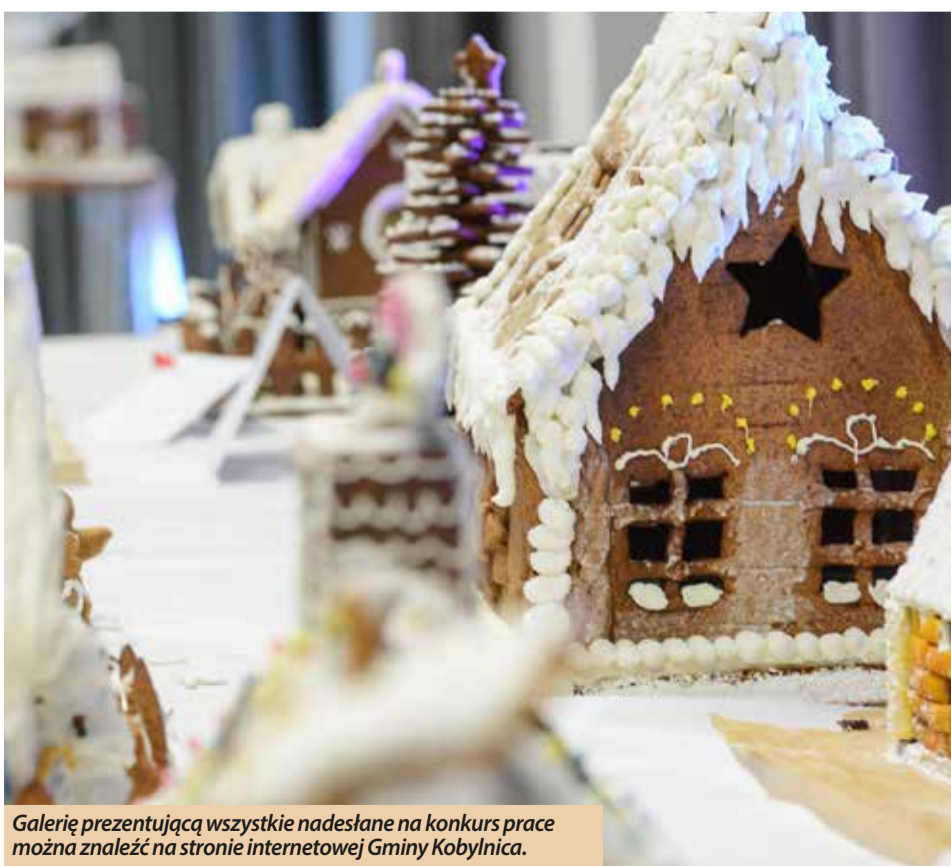
Galerię prezentującą wszystkie nadesłane na konkurs prace można znaleźć na stronie internetowej Gminy Kobylnica.