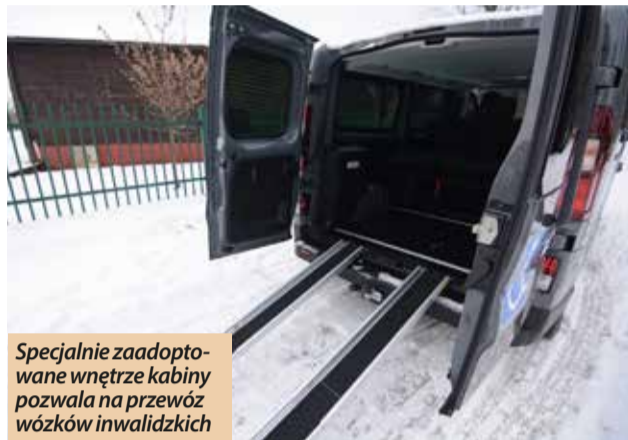
Specjalnie zaadaptowane wnętrza kabiny pozwala na przewóz wózków inwalidzkich

Nowy pojazd do przewozu osób niepełnosprawnych to Renault Traffic. Pojazd napędzany jest silnikiem diesla o mocy 125 KM. Specjalnie zaadaptowane wnętrza ka-