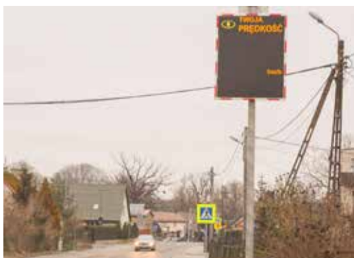
Tablice LED mają wpływać na zachowanie kierowców poprzez wyświetlający się krótki komunikat o prędkości poruszającego się pojazdu

Pamiętajmy jednak, że żadne urządzenie nie zastąpi odpowiedzialności i rozważ.