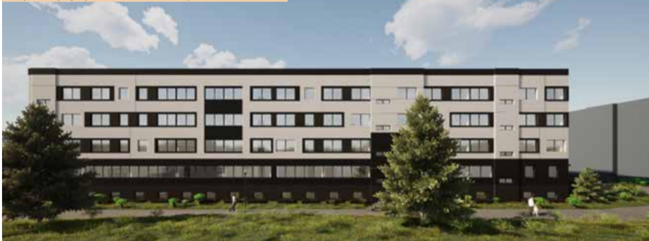
Dolną kondygnację przedstawionego na wizualizacji budynku będą zajmować sale szkolne i przedszkolne