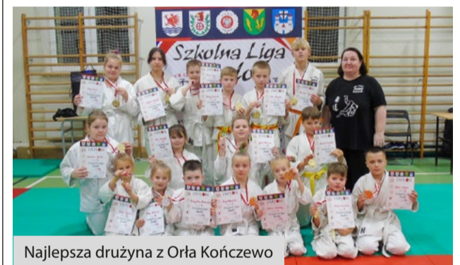
Najlepsza drużyna z Orla Kończewo