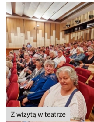
Z wizytą w teatrze

Projekt „Srebrna Sieć II” w ramach którego działa Klub Seniora w Widzinie realizowany jest w ramach Priorytetu 6 – Integracja, Działania 6.2. Usługi społeczne, Poddziałania 6.2.2. Rozwój usług społecznych Regionalnego Programu Operacyjnego Województwa Pomorskiego na lata 2014 – 2020. Projekt jest współfinansowany przez Unię Europejską w ramach Europejskiego Funduszu Społecznego. Całkowity koszt Projektu wynosi 4 290 086,50 zł. w tym dofinansowanie wynosi 4 075 582,17 zł.