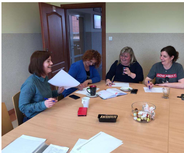
Zdjęcie 1. Warsztaty z pracownikami kultury i mieszkańcami.

Materiał badawczy został zebrany podczas warsztatów z pracownikami instytucji kultury oraz mieszkańców w ośmiu gminach: Damnica, Dębica Kaszubska, Główny, Kępice, Kobylnica, Potęgowo, Słupsk, Smołdzino, oraz podczas wywiadów grupowych z pracownikami CKPS. Łącznie w diagnozie wzięło udział ponad 150 osób.