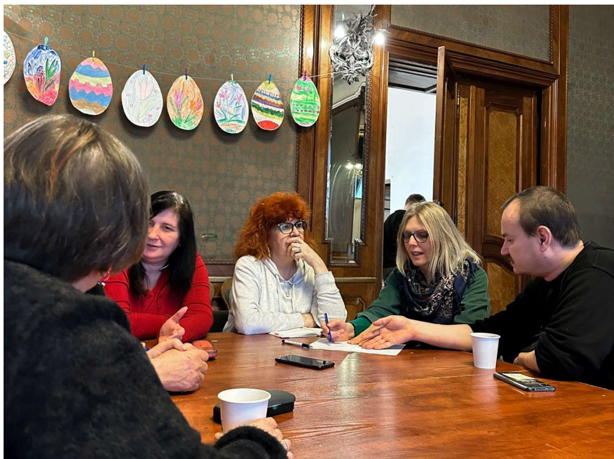
Zdjęcie 3. Warsztaty z pracownikami kultury i mieszkańcami.

szeroki i w dużej mierze uzależniony od zasobów instytucji. Rekomendujemy więc, by testować różne metody komunikacyjne i ewaluować je z odbiorcami.