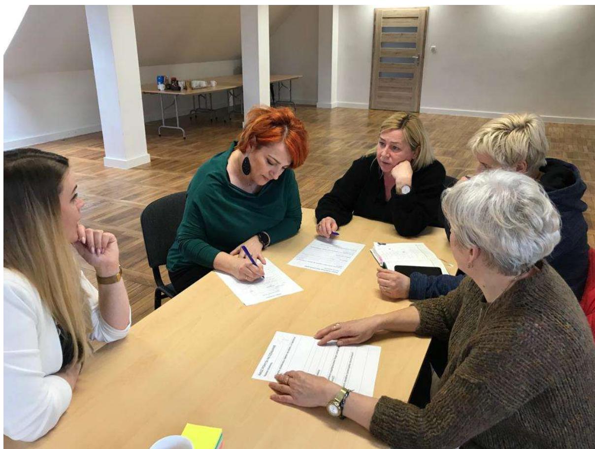
Zdjęcie 2. Warsztaty z pracownikami kultury i mieszkańcami.

Powyższy kontekst oraz charakterystyka CKPS stanowi podstawę do dalszych rozważań nad wspomnianymi wyżej obszarami badawczymi.